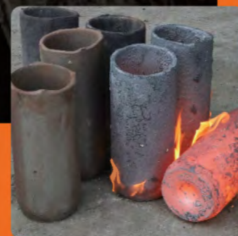
جنس: ۱-۷۲۲۰ قطر خارجی: ۱۶۰ میلی متر قطر داخلی: ۱۴۲ میلی متر ارتفاع: ۳۲۰ میلی متر

در صنعت به منظور تولید بعضی از قطعات، می بایست از لوله های بدون درز استفاده نمود که متاسفانه به علت عدم وجود این گونه از لوله ها به ویژه در جنس های آلیاژی، معمولاً از روشهای دیگری من جمله گردبری و یا ماشینکاری، استفاده می گردد که موجب هدر رفت بسیار زیاد مواد و به دنبال آن افزایش قیمت تولید می گردد. از جمله مهم ترین کاربرد این لوله ها می توان به تولید انواع سیلندر، رینگ ها، واشر ها، پوسته ها و ... اشاره نمود. راه اندازی خط تولید اکستروژن داغ و فرمینگ گرم و سرد در این مجموعه، این امکان را فراهم می آورد که با استفاده از جنس های