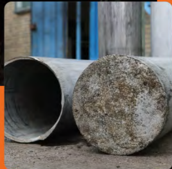
جنس: AA 2024 قطر خارجی: ۱۳۹ میلی متر قطر داخلی: ۱۳۱ میلی متر ارتفاع: ۳۲۰ میلی متر