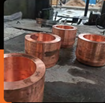
جنس: مس خالص قطر خارجی: ۳۳۶ میلی متر قطر داخلی: ۲۳۸ میلی متر ارتفاع: ۳۰۰ میلی متر