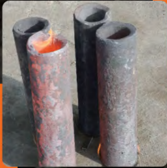
جنس: Ck45 قطر خارجی: ۱۰۲ میلی متر قطر داخلی: ۷۷ میلی متر ارتفاع: ۴۵۰ میلی متر