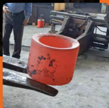
جنس: استنلس استیل ۳۱۶ قطر خارجی: ۲۹۰ میلی متر قطر داخلی: ۲۵۶ میلی متر ارتفاع: ۲۹۰ میلی متر